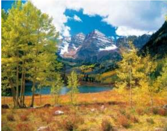
Das Panorama der Rocky Mountains