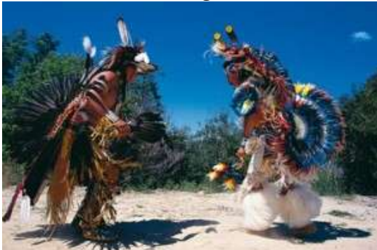
Indianer der Prärie