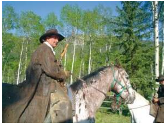
Es gibt sie immer noch: Cowboys