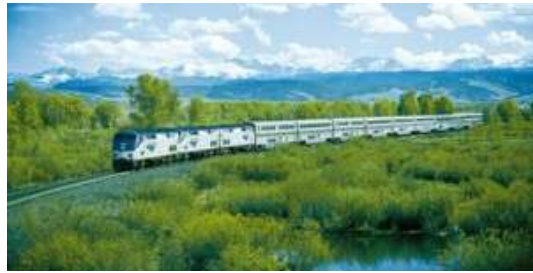
Der California Zephyr