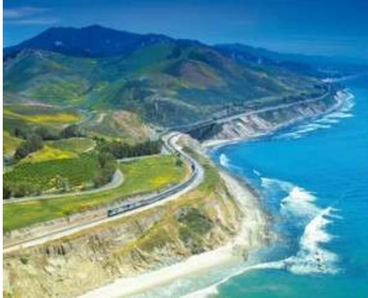
Mit dem Zug entlang der Küste