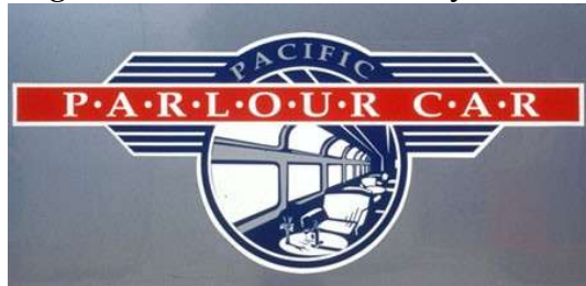
Amtrak – California Zephyr