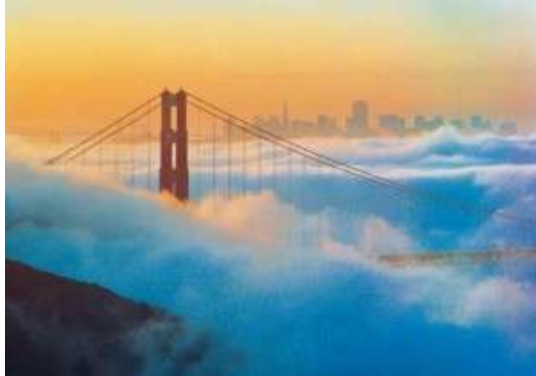
Die Golden Gate Bridge in San Francisco