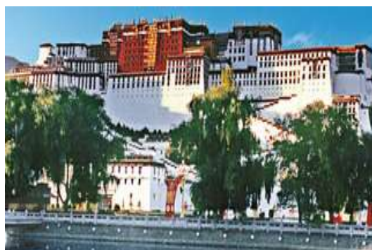
Lhasa – Potala Palast