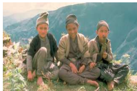
Beobachtungen am Wegesrand

14. Tag: Heimreise (F). Morgens Transfer zum Flughafen und Rückflug nach Deutschland.